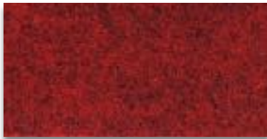
6102 ROT MELIERT