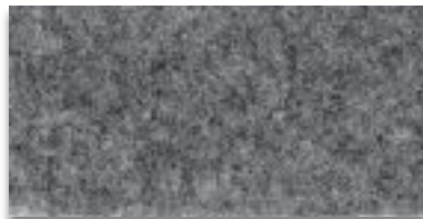
6125 HELLGRAU MELIERT