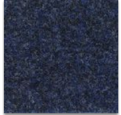
6104 BLAU MELIERT