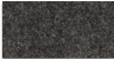
6108 BRAUN MELIERT