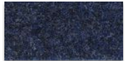
6104 BLAU MELIERT