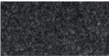
6105 DUNKELGRAU MELIERT