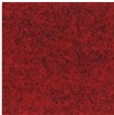
6102 ROT MELIERT