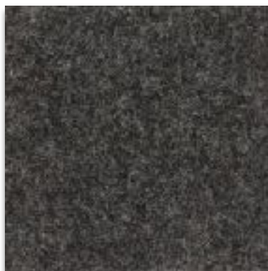
6108 BRAUN MELIERT