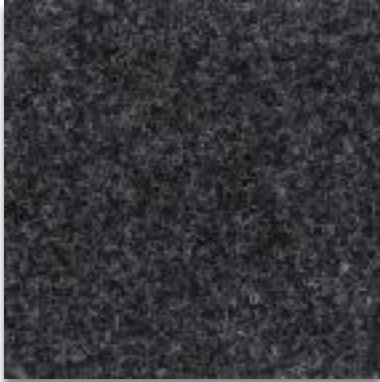
6105 DUNKELGRAU MELIERT