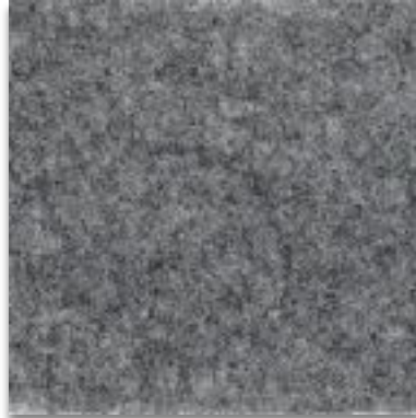
6125 HELLGRAU MELIERT